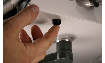
Figura 1: XO Interruptor de configuración

Mientras configura un instrumento, el otro instrumento adopta el mismo valor para la velocidad (o frecuencia), el agua refrigerante y agua de pulverización).