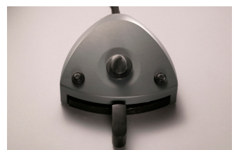
Figura 3: Control de pie de XO