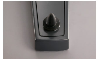
Figura 2: Palanca de mandos de XO