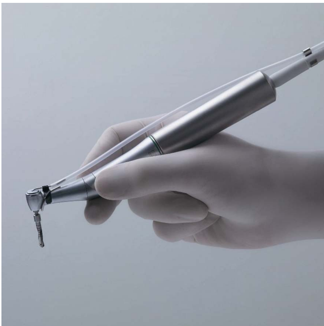
YB-621 Version 1.01

XO CARE A/S Usserød Mølle Håndværkersvinget 6 DK 2970 Hørsholm Denmark